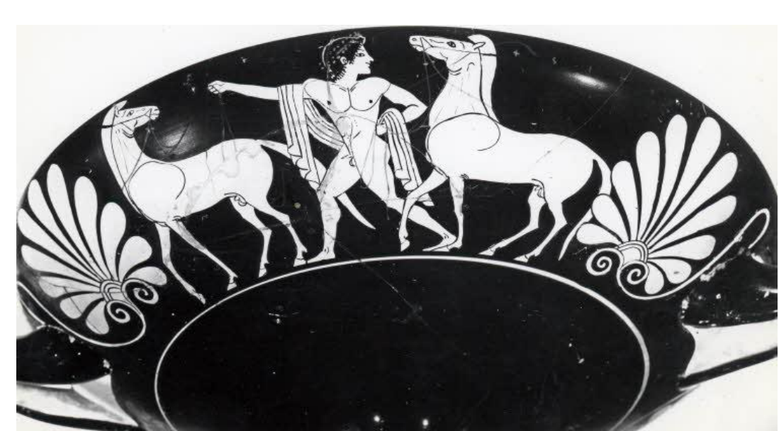
Fig. 4 a et b. Coupe attribuée au peintre d'Euergidès. Metropolitan Museum of Art, New-York, 09.221.47.