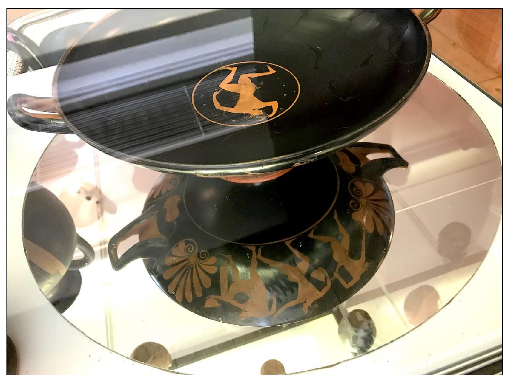
Fig. 1. Coupe du peintre Euergidès. Musée des Beaux-Arts de Tours