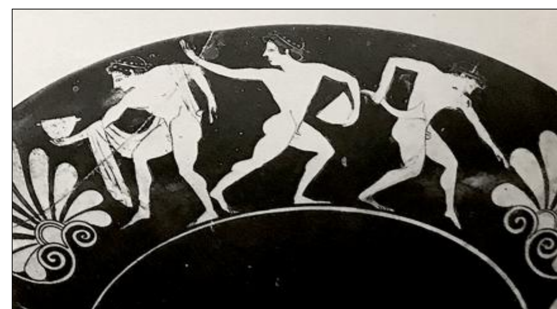
Fig. 2. Face A de la Coupe du peintre Euergidès. Musée des Beaux-Arts de Tours d'après Pierre Rouillard, Corpus Vasorum Antiquorum , France, Musée des Beaux-Arts à Tours, Musée du Berry à Bourges, Paris, 1980, pl. 10.