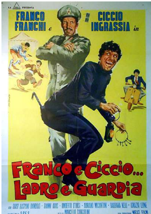
Figure 2. Affiche du film Franco e Ciccio... ladro e guardia (1969)

couple Franchi-Ingrassia qui ne présentent des indices liés au milieu du cirque. Par exemple, au début du film Due bianchi nell'Africa nera (Bruno Corbucci, 1970), les deux protagonistes travaillent comme concierges dans un cirque, d'où ils partent pour le continent africain à la recherche d'animaux sauvages. Dans ce milieu, Franco est le seul à pouvoir communiquer avec le chimpanzé Filiberto, qui devient en quelque sorte le troisième héros de l'histoire.