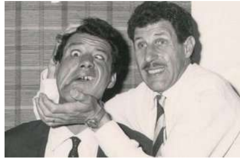
Figure 3. Franco Franchi (à gauche), l'homme-marionnette vs Ciccio Ingrassia (à droite), l'homme sans qualités.

La contradiction se manifeste surtout sur le plan physique : la malléabilité du corps de Franco Franchi (souple mais toujours prêt à se raidir comme un mannequin), est mise en contraste avec la banalité corporelle de Ciccio. (Figure 3). Il faut également souligner que la vitalité irrépressible de Franco se traduit par une impulsivité sexuelle explosive, tandis que la figure de Ciccio s'enorgueillit de montrer une indifférence particulière à l'égard du genre féminin. En adoptant des catégories marxistes, on pourrait dire que le corps trapu de Franco est celui du sous-prolétarien, tandis que la figure élancée de son partenaire incarne la prétendue intégrité morale du petit-bourgeois : entre les deux, contraints de coexister pour survivre, la proximité ne peut que déboucher sur une lutte.