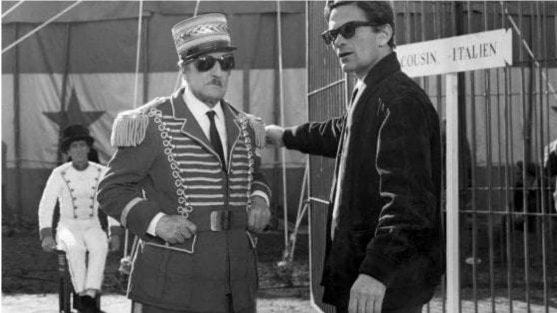
Pier Paolo Pasolini et Totò sur le set de L'aigle, épisode coupé des Oiseaux petits et gros (1966) Angelo Novi © Cineteca di Bologna

En 1966, Pasolini avait prévu d'inclure dans son film Des Oiseaux petits et gros un épisode à la fois fantastique et apologétique, dans lequel il s'attaquait au chauvinisme français et à l'arrogance colonialiste de l'homme blanc. Il confie à Totò le rôle d'un dompteur à moustache qui prétend apprivoiser un aigle royal, symbole du Tiers Monde... Le vieux comédien, Totò revient ainsi à la caricature et au mime : il parle aux animaux et va jusqu'à se métamorphoser en oiseau de proie dans la scène finale. Une satire piquante de nos sociétés occidentales avec des hommes et des bêtes qui parlent comme dans une fable d'Ésope. L'aigle ou Totò au cirque est donc cet épisode coupé d'une durée de huit minutes, silencieux car jamais doublé, retrouvé par Laura Betti 14 qui y a ajouté les sous-titres du script et dont l'Istituto Luce Cinecittà à Rome possède désormais la copie.