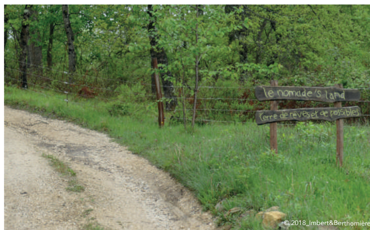
« Le nomade's land. Terre de rêves et de possibles » ◀ Crédit : Christophe Imbert et William Berthomière, mai 2018