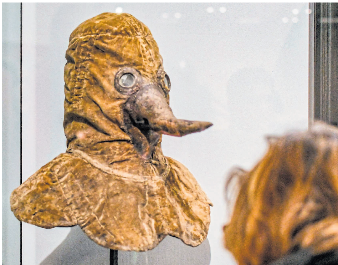
Mittelalterlicher Mundschutz: Eine Pestmaske, ausgestellt in einem Berliner Museum.

Historiker Martin Bauch befasst sich mit mittelalterlichen Pandemien und der Frage, welche Lehren die Menschen daraus gezogen haben