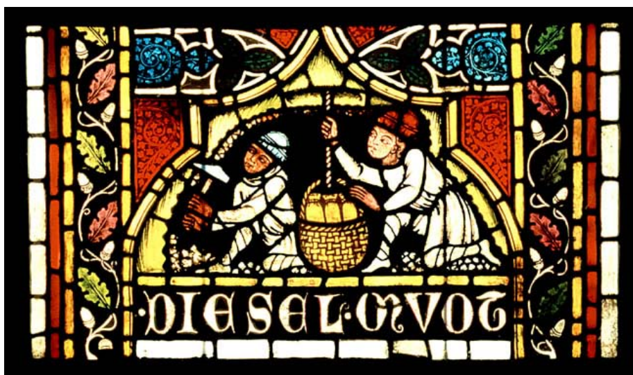
Freiburg Münster, Tuluhauptfenster, vers 1320-30 (c. Corpus Vitrearum Freiburg)

* Persönliche Ausrüstung: Gummistiefel und „abenteurgerechte“ Kleidung. Helm Helm zur Verfügung gestellt.