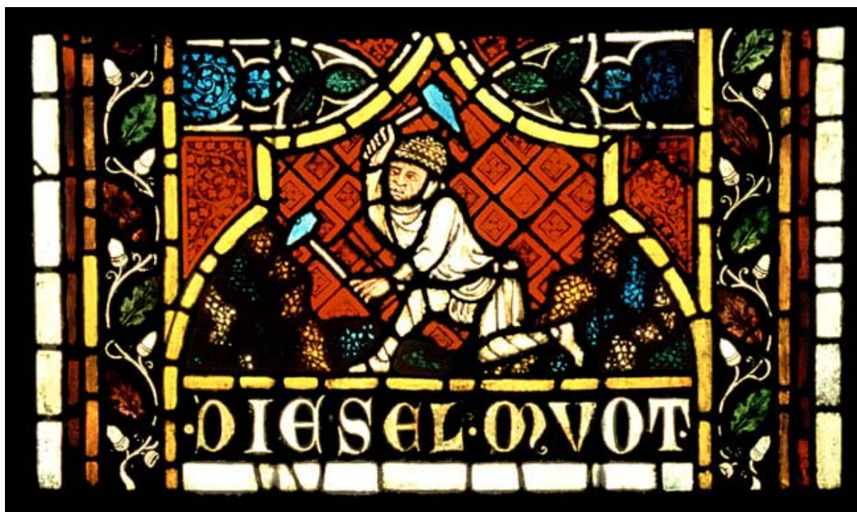
Freiburg Münster, Tulenhauptfenster, vers 1320-30