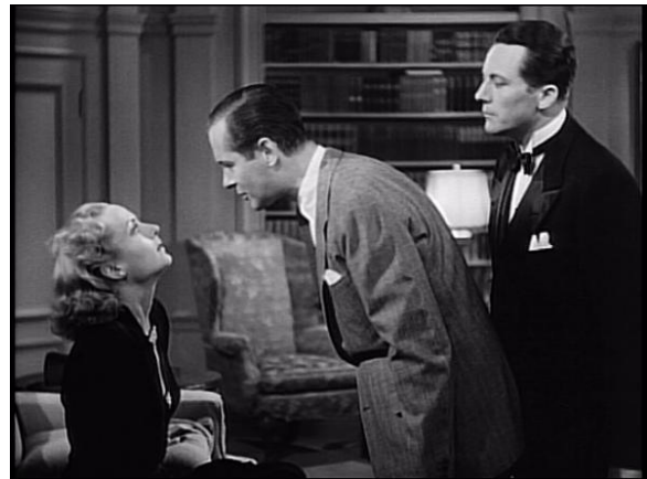
Robert Montgomery (David Smith), Carole Lombard (Ann Smith) et Gene Raymond (Jeff Custer)

La comédie des années 1930-1940 donne souvent l'impression que la capacité d'un personnage à prendre le dessus sur les autres est une qualité essentiellement féminine : l'héroïne comique est ainsi celle qui impose un rythme au récit, et son point de vue sur l'action. Elle désigne les objets du désir et les fait siens. Elle est le point de repère par rapport auquel l'axe de jeu est défini, et autour duquel les autres personnages gravitent : l'unique déplacement de l'héroïne vers l'arrière-plan entraîne le déplacement de Jeff Custer et oblige David Smith à réorienter son regard, à suivre continuellement un mouvement esquissé par les autres personnages. La facilité des uns et la difficulté des autres à se replacer par rapport à la caméra dénote une nouvelle hiérarchie. Le mérite revient ici à celui qui bouge le moins, comme si le mouvement était un aveu visuel de détresse.