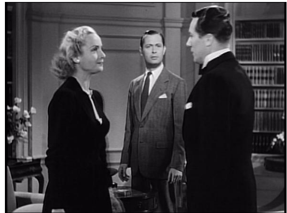
Carole Lombard (Ann Smith), Gene Raymond (Jeff Custer) et Robert Montgomery (David Smith)

Par ailleurs, la relation de David Smith à « l'autre homme » est primordiale à plusieurs niveaux.