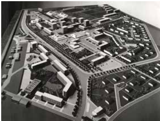
À gauche : Maquette du quartier des Coquets par François Herr et René-André Coulon, vers 1966.

Au premier plan, le parc de la Sete à gauche et les lotissements pavillonnaires à droite. Au centre, le projet du centre commercial des Coquets et le parc de Beotonnie. À l'arrière plan, l'église Notre-Dame de la Miséricorde et le centre sportif. À droite, une alternance de petites barres d'immeubles, de maisons jumelées et de pavillons indépendants. Ce plan d'aménagement sera en grande partie remanié par la SARR et la municipalité, qui réduiront la part des équipements publics et de l'habitat collectif.