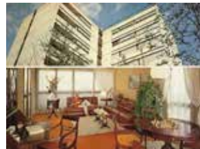
Prospectus de promoteur du parc de la Londe, vers 1973.

Au premier plan, le parc de la Sete à gauche et les lotissements pavillonnaires à droite. Au centre, le projet du centre commercial des Coquets et le parc de Beotonnie. À l'arrière plan, l'église Notre-Dame de la Miséricorde et le centre sportif. À droite, une alternance de petites barres d'immeubles, de maisons jumelées et de pavillons indépendants. Ce plan d'aménagement sera en grande partie remanié par la SARR et la municipalité, qui réduiront la part des équipements publics et de l'habitat collectif.