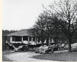
Club House du golf de Mont-Saint-Aignan, 1955.