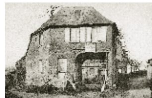
La ferme Bertrand, carte postale de la fin du XIX e siècle. La ferme se situait à l'angle du chemin des Cottes et de la sente des Baulins.

En 1897, la récolte de céréales de la commune atteint 4 503 hectolitres. C'est six fois plus qu'au début du siècle ! Mais le blé représente 72% du total des céréales. La diversité naturelle, comme l'on dit aujourd'hui, est déjà en net recul... Et aux céréales s'ajoutent, désormais, la pomme de terre et la betterave à sucre. À la Belle Époque, les plus grandes fermes, comme la « Familiale » ou encore la ferme du Cotillet, exploitée pendant près d'un siècle par la dynastie d'agriculteurs des Dutoit, rattachée au domaine de la comtesse de Guillebon et aujourd'hui recouverte par le campus universitaire, dépassent la trentaine d'hectares. Au début des années 1970, 21 exploitations agricoles sont encore recensées par le fisc sur le territoire de Mont-Saint-Aignan. La ferme de la Vatine, la plus grande, couvre près de 60 hectares. La ferme Carpentier, d'une surface totale de 6 hectares, rue du Fond du Val, produit aussi des fleurs. Mais les légu-