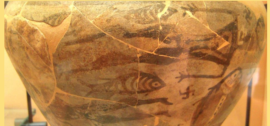
Cratère tardo-géométrique de fabrication locale, Musée archéologique de Pithécusses, inv. 168813.

14h45 Francesco QUONDAM (Université de Bâle, Suisse), L'Italia dei centri protourbani: percorsi regionali a confronto