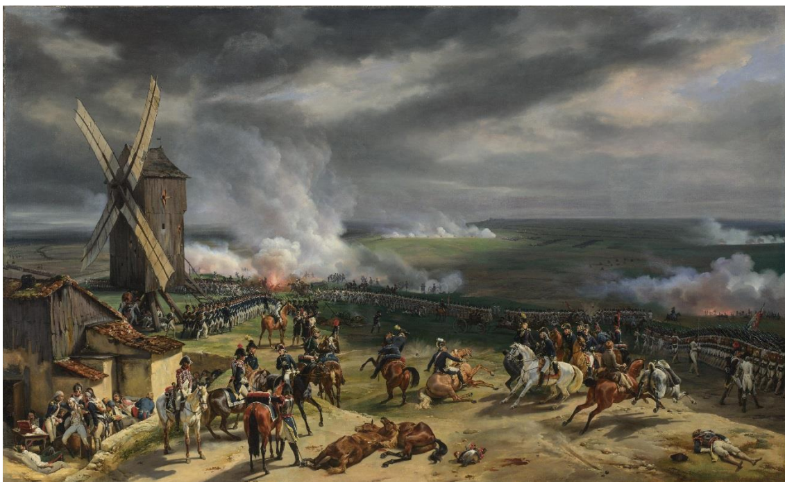
Emile-Jean Horace Vernet, Die Schlacht von Valmy, um 1826, Copyright © The National Gallery, London, Quelle: http://www.nationalgalleryimages.co.uk/ via Wikimedia Commons, gemeinfrei

Die Szene war paradox. Vor der Front der preußischen Armee, die langsam auf den Feind zu avancierte, waren sämtliche Geschützbatterien aufgefahren worden, derer man habhaft werden konnte. Und plötzlich, mit ohrenbetäubendem Schlag, noch während die Regimenter unter klingendem Spiel vorrückten, begann auf beiden Seiten die Kanonade – mit einer schockierenden Gewalt, die ins Gedächtnis sich zurückzurufen selbst den Dabeigewesenen schwerfiel. 4 Das gut liegende Feuer der vorteilhaft auf dem Hang positionierten französischen Kanonen brachte die Reihen der Preußen schnell zum Stehen. „Von der ungeheuren Erschütterung [der kreuz und quer einschlagenden Kugeln] klärte sich der Himmel auf“, berichtet uns Johann Wolfgang Goethe, der an der Kampagne teilnahm, „denn man schoß mit Kanonen völlig, als wär` es Pelotonfeuer, zwar ungleich, bald abnehmend, bald zunehmend.“ 5 Doch erinnerte sich der Dichter nicht richtig, denn der Nebel hatte sich bereits verzogen und der Pulverdampf der abgefeuerten Geschütze wie der der Musketen, hüllten das Schlachtfeld erneut in Dunst und Rauch. Umso schrecklicher wirkte der Donner der Kanonen.