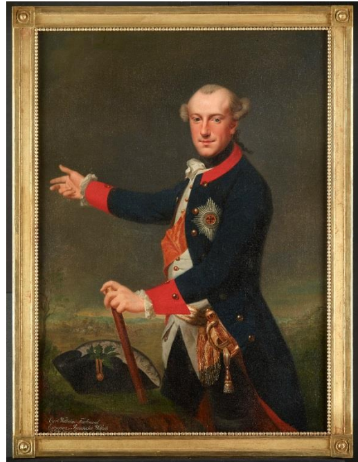
Johann Georg Ziesenis, Erbprinz Karl Wilhelm Ferdinand von Braunschweig (1735-1806)

Am 20. September des Jahres 1792, einem nassen und nebeligen Herbsttag, sollte sich das Leben des preußischen Generalfeldmarschalls Karl Wilhelm Ferdinand von Braunschweig-Lüneburg unlöslich und für alle Zukunft mit dem Schicksal der Kampagne in Frankreich verbinden. Der Herzog und Befehlshaber der preußischen Armee hatte nahe bei Valmy, im Lager des Erbprinzen von Hohenlohe eine kurze, unruhige Nacht verbracht. Als der Morgen graute, begab er sich auf den Mont Remoi, um die Bewegungen des feindlichen französischen Revolutionsheeres zu beobachten. In günstigen Momenten konnte er von seiner Position aus durch die Nebelschleier jenseits der Aisne das