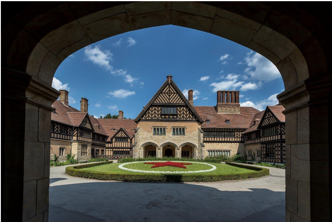
Abbildung 1 Schloss Cecilienhof, Blick in den Ehrenhof mit gepflanztem Sowjetstern

Als am 17. Juli 1945 der sowjetische Generalissimus Josef Wissarionowitsch Stalin, der britische Premierminister Winston Churchill und der amerikanische Präsident Harry S. Truman die große Halle im Schloss Cecilienhof in Potsdam betraten, wurden sie von einem Blitzlichtgewitter der Fotografen empfangen. Seit Anfang Mai schwiegen die Waffen, der Zweite Weltkrieg in Europa war vorüber, während der Krieg in Asien gegen das japanische Kaiserreich mit unverminderter Härte fortgeführt wurde. Nun schaute die Welt auf das mit Spannung erwartete Zusammentreffen der Großen Drei, diesen „... einzigen Augenblick, der alles bestimmt und alles entscheidet“: „Ein einziges Ja, ein einziges Nein, ein Zufrüh oder ein Zuspät macht diese Stunde unwiderruflich für hundert Geschlechter und bestimmt das Leben eines Einzelnen, eines Volkes und sogar den Schicksalslauf der ganzen Menschheit. Solche dramatisch geballten, solche schicksalsträchtigen Stunden, in denen eine zeitüberdauernde Entscheidung auf ein einziges Datum, auf eine einzige Stunde und oft nur eine Minute zusammengedrängt ist, sind selten im Leben eines Einzelnen und selten im Laufe der Geschichte.“ 1