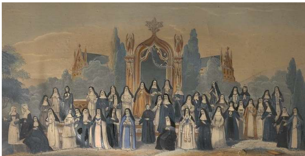
Ordres religieux Costumes de femmes. Tableau historique d'après le P. Hélyot, © KIK-IRPA, Bruxelles