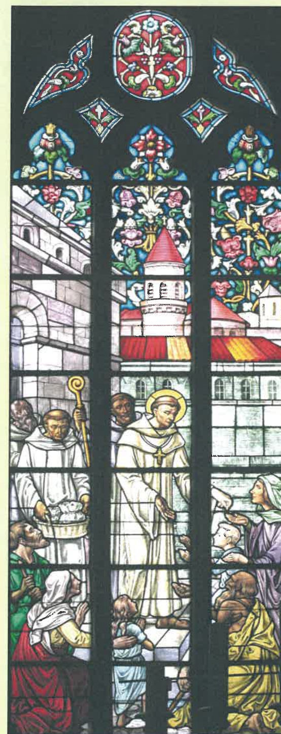
Église de Wormhout, « Saint Winoc donne argent et pain aux mendiants ».

Vendredi 29 et samedi 30 septembre 2017 Colloque à Bergues