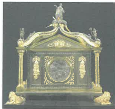
Musée de Bergues, chasse de saint Winoc.