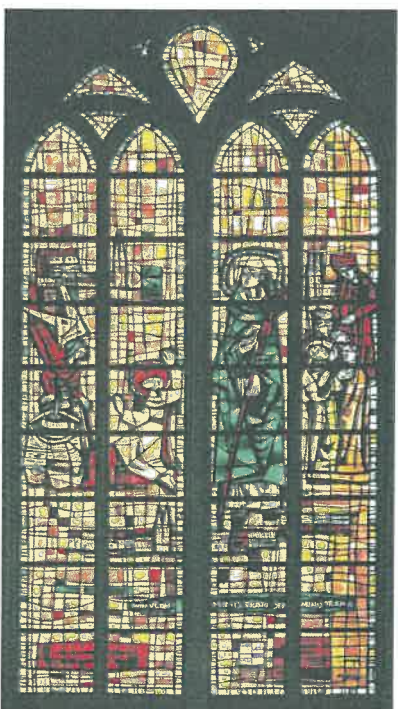
Église de Bergues, vitrail, épisodes de la vie de saint Winoc.