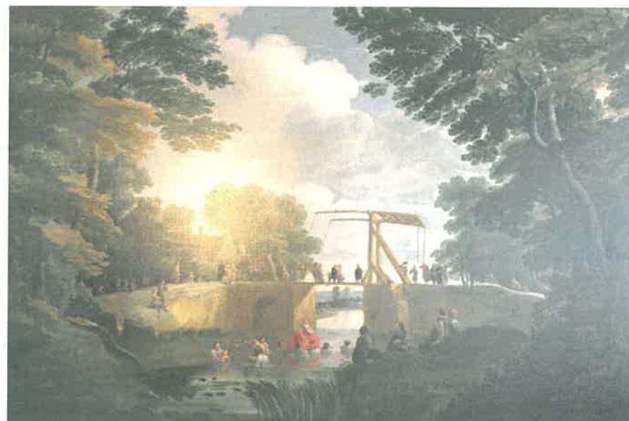
Musée de Bergues, J.-B. Van Meunynghoven, « Le bain des reliques de saint Winoc ».

Le 4 août 1789, dîmes et rentes seigneuriales sont supprimées ; le 2 novembre, les propriétés sont déclarées biens nationaux. Les religieux sont chassés le 18 juin 1791. Les livres et œuvres d'art sont alors dispersés. Ils témoignent du haut niveau culturel des religieux. Les bâtiments furent vendus et détruits à l'exception de deux tours. Le site est actuellement occupé par un jardin public.