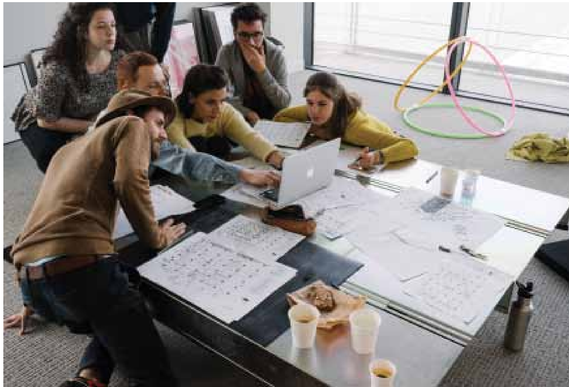
Journées de recherche au CNEAI, mai 2017.