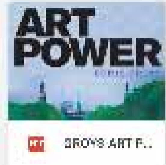
GROYS ART P...