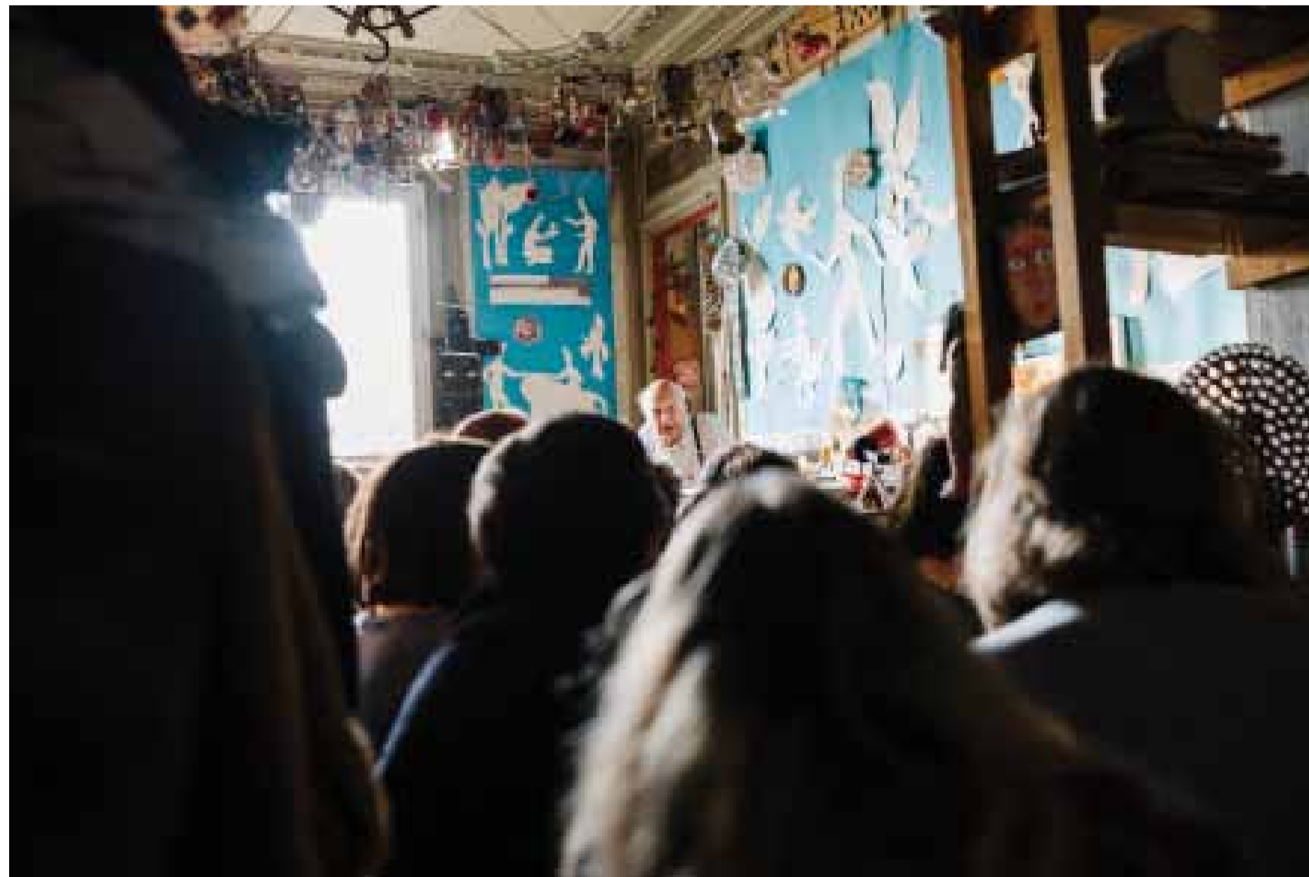
rencontre avec Yona Friedman, mai 2017.