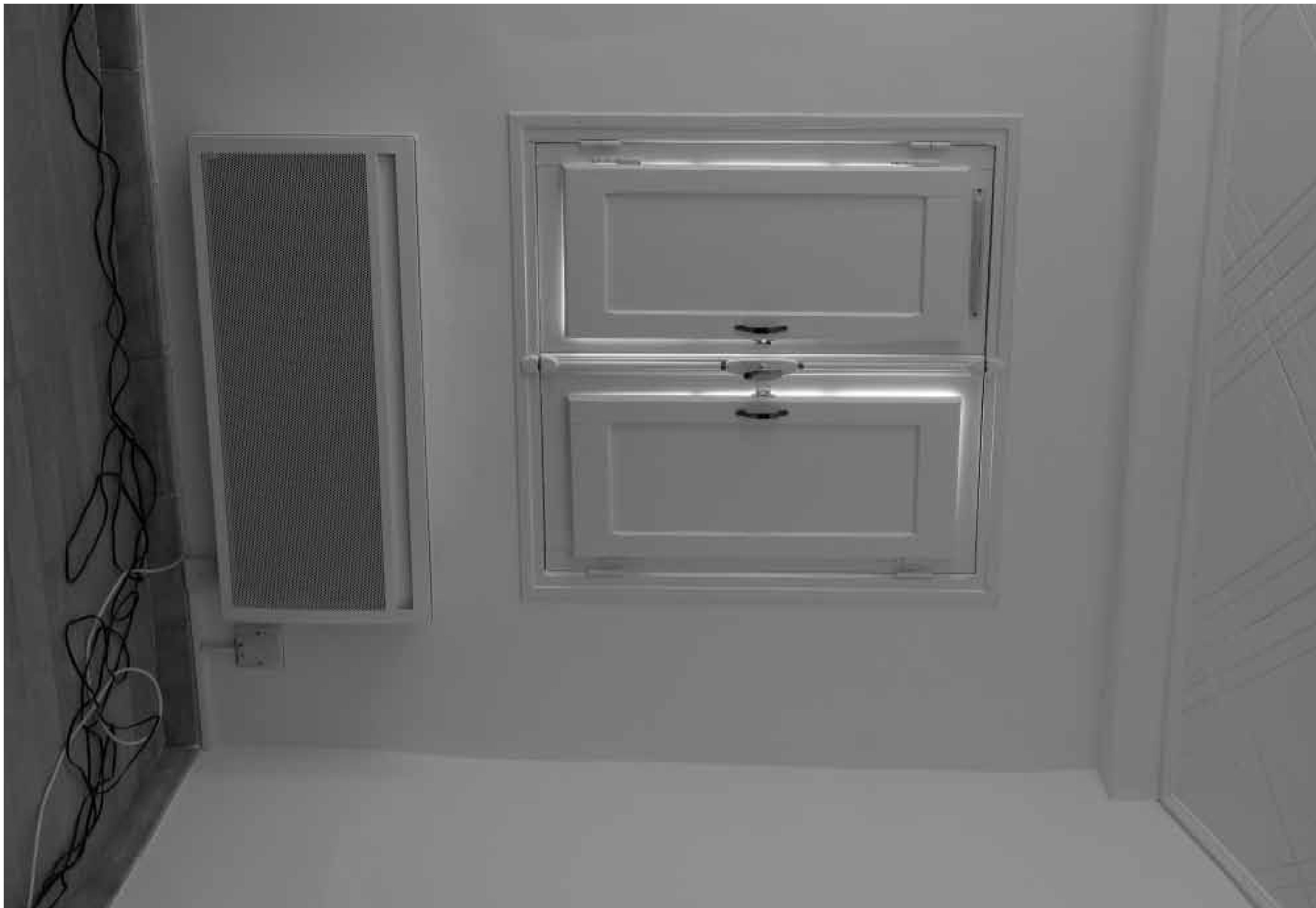
Quentin Carrière. Blind, 111x148 cm, tirage jet d'encre contrecollé sur Dibond et caisson en bois (courtesy de l'artiste, collection particulière).