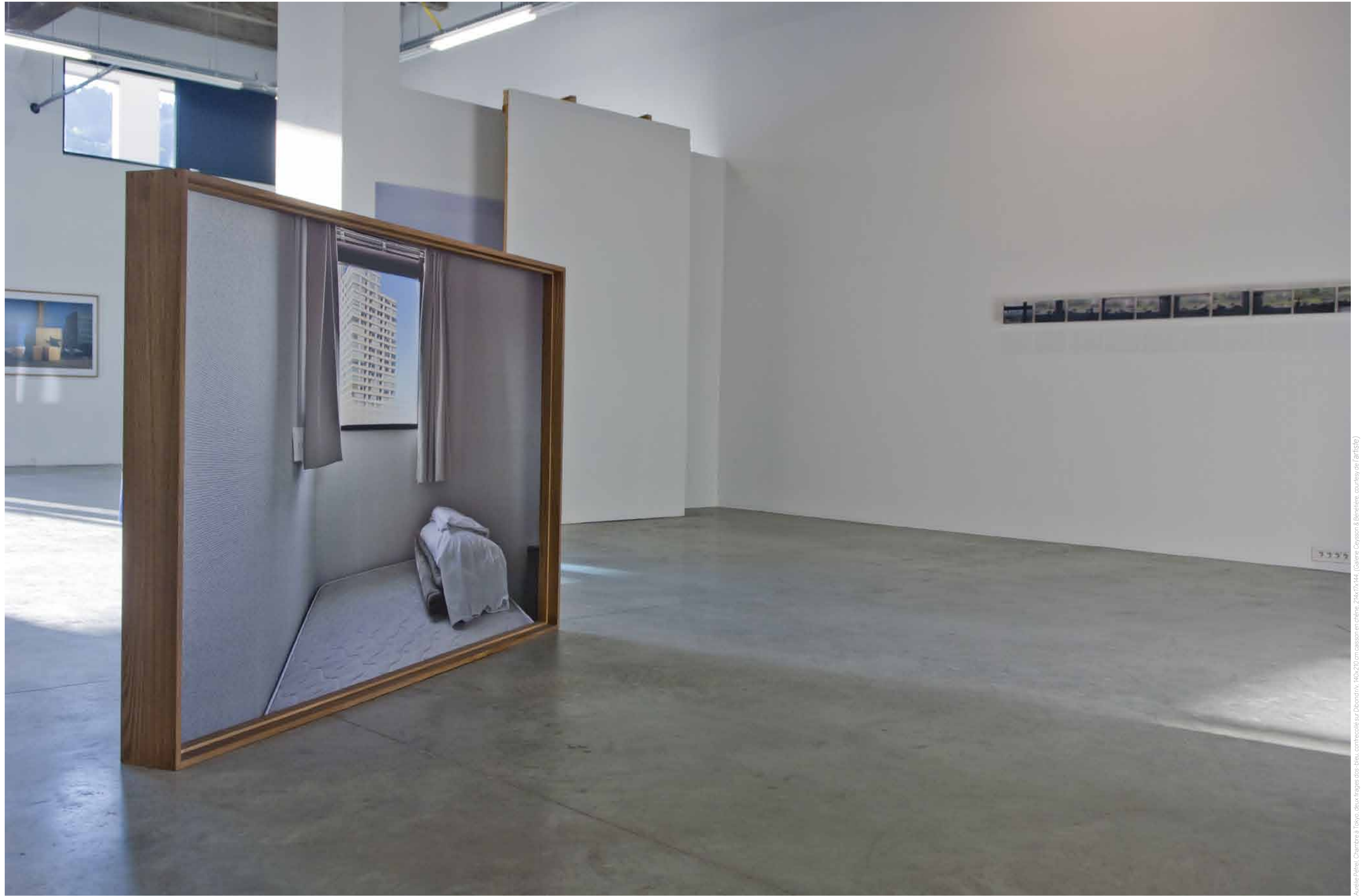
Aurélie Pétrei, Chambre à Tokyo , deux tirages dos-bleu, contrecollés sur Dibond trix, 140x210 cm caisson en chêne, 214x171x144.