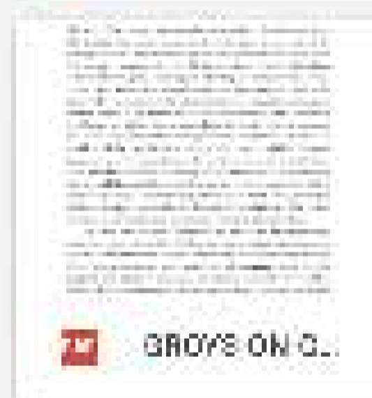
GROYS ON G...