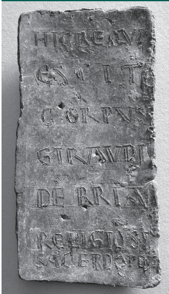
Angers, SDA. Endotaphe provenant de Fontevraud (XII e siècle)

Coordinación: Vincent DEBIAIS (CNRS / UMR 7302, CESC, Poitiers) Carles MANCHO (Universitat de Barcelona)