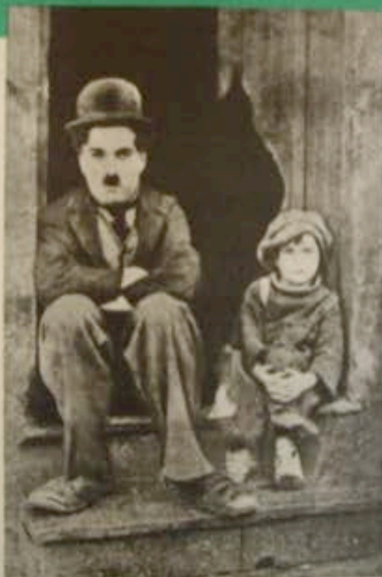
LE GOÛT (The Kid) - Charlie Chaplin Collection - Maurice BÉTY