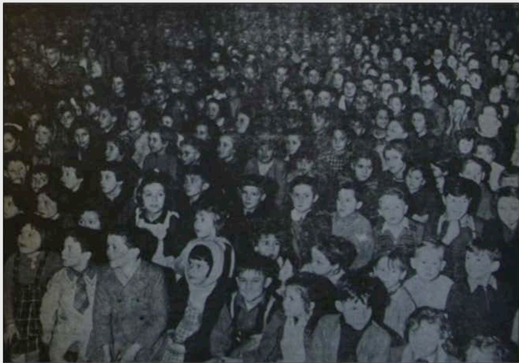
Enfants à une séance banc d'essai en 1961 Ciné-jeunes n°26, 2 e trimestre 1961)