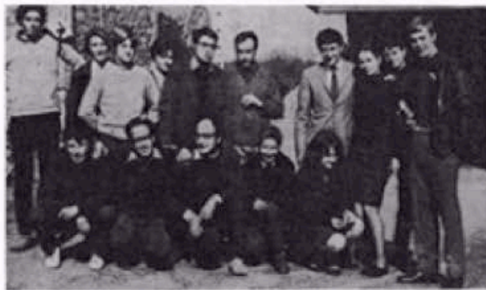
Stagiaires et responsables

Vingt cinéastes ont séjourné à St-Marc-le-Blanc et sillonné tout le canton