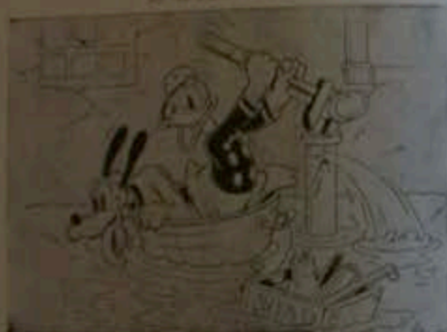
Illustration de Pierre-Jean Ferron

ET LA REVUE "CINE JEUNES" SOUS LE PATRONAGE DE L'INSTITUT PEDAGOGIQUE NATIONAL 25 rue d'Orléans - Paris-17