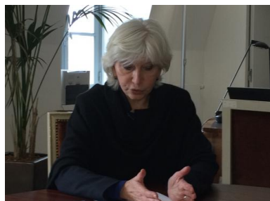
Laurence Tubiana

Laurence Tubiana : C'est une chose de dire que c'est très difficile, c'en est une autre de ne pas le faire. Il y a déjà du réalisme à dire qu'il faut endiguer le plus vite possible le phénomène. Il y a une espèce de nécessité impérieuse, un impératif moral, mais aussi un impératif politique, qui fait que cette négociation ne meurt pas. On enterre à Copenhague et à Cancun l'idée d'un accord juridiquement contraignant et trois ans après, on remet ça en disant « il faut un mandat pour qu'on y arrive ». Cela montre qu'on ne peut pas renoncer.