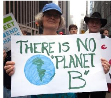
Marche pour le climat à New York

sonnent l'alarme en 1972. Ensuite il y a la convention climat de Rio ( en 1992 – ndlr ). En réalité, cela ne fait que 20 ans qu'on discute de ce sujet.