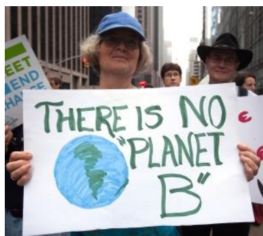
Marche pour le climat à New York

PAR CHRISTOPHE GUEUGNEAU ET JADE LINDGAARD ARTICLE PUBLIÉ LE LUNDI 6 AVRIL 2015