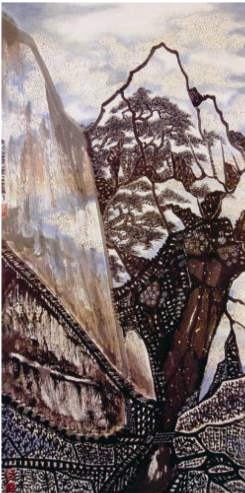
III. 3 Les rails de chemin de fer jaillissent des montagnes ( 鐵軌出岫圖 Tiegui chu xiu tu)