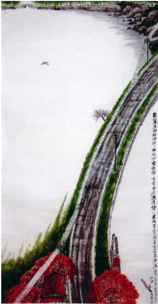
III. 5 Vignes desséchées, vieux arbres et route d'asphalte ( 枯藤老樹柏油路 Ku teng laoshu boyoulu ) (2011 ; 179 x 96 cm).

Et nous devons payer le taxi de nos vies