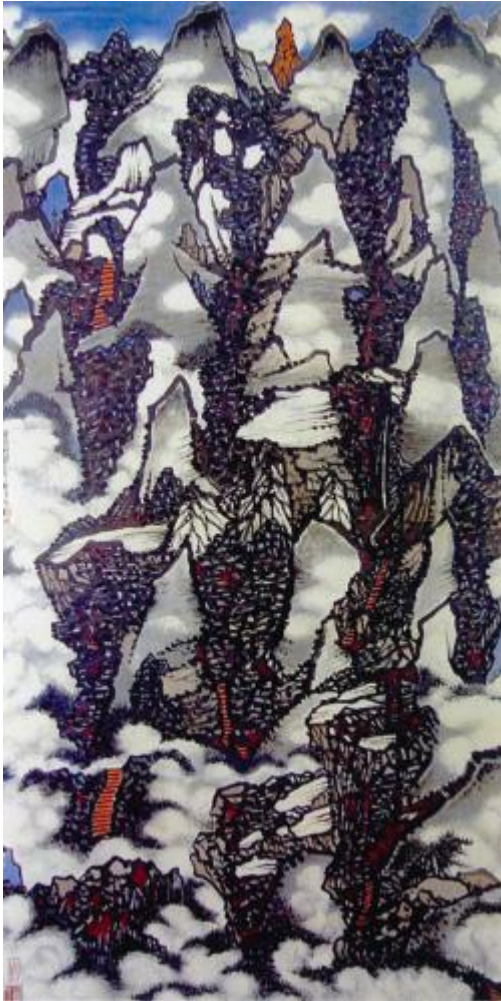
III. 2 Dix mille ravins et nuages auspicioeux ( 萬壑祥雲 Wanhe xiangyun ) (1997 ; 137 x 69 cm).

mince bande de ciel qui apparaît tout en haut, rouge carmin des feuillages, ocre des escaliers. Les rochers s'empilent en des entrecroisements de plans complexes pour former une composition dynamique. Le cheminement à travers les montagnes est matérialisé par un escalier, élément inhabituel dans les peintures classiques, réapparaissant de loin en loin et attirant l'attention du spectateur. Comme toujours chez Lo Ch'ing, aucun lettré ni aucun paysan n'est représenté ici, mais l'escalier suffit à évoquer une présence humaine.