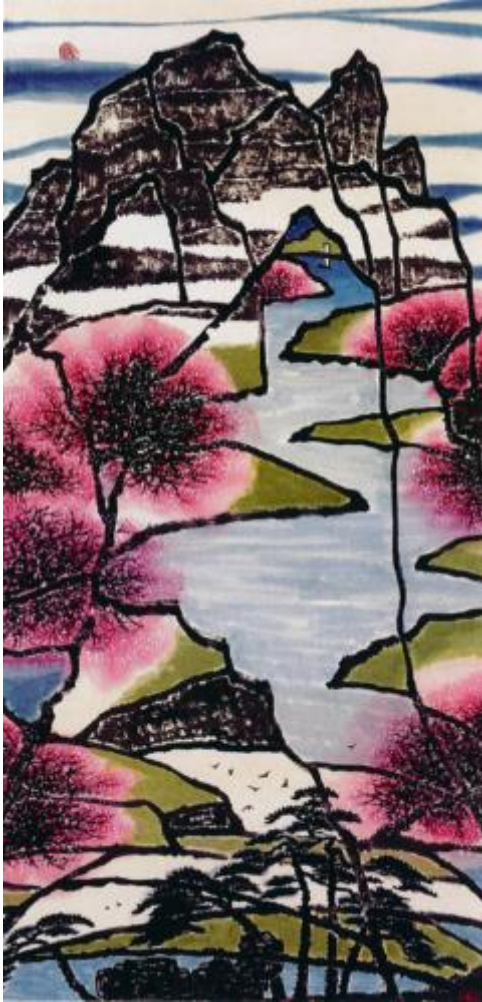
III. 6 Le rêve de visite à la Source aux fleurs de pêcher ( 夢中暗戀桃園花 Meng zhong an lian taoyuanhua ) (2008 ; 137 x 69 cm).