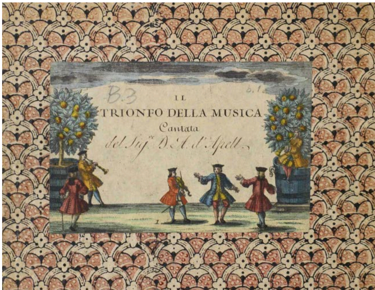
Piatto di Il Trionfo della Musica di David August von Apell, Fondo Pitti

Musiche di Luigi Cherubini e di Wolfgang Amadeus Mozart eseguite dalla Rinnovata Accademia di Generosi