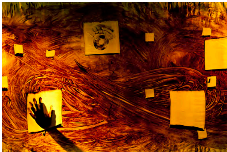
Fig.3: Spectacle Tierra Efímera .

Le travail de mise en scène de la matière s'est avéré une source constante de découvertes et de surprises. Chaque terre, selon sa granulométrie et le type d'argile qu'elle contient, s'exprime d'une façon particulière. Le langage d'une terre argileuse n'est pas le même que le langage d'une terre sableuse. De même, celui de la terre à l'état liquide ne s'exprime pas de la même manière que celui d'une terre à l'état sec. La matière a son mot à dire, parfois en contradiction avec ce que nous avons imaginé auparavant.