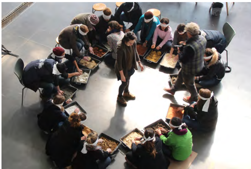
Fig.10 : Découverte sensorielle de la matière terre.

Un maçon connaît exactement la teneur en eau d'un enduit au toucher, ainsi que de la terre à pisé avant de la mettre en œuvre. Un des objectifs d'amàco est d'intégrer ces informations « non théoriques » pour développer les intelligences multiples des apprenants. Dans ce contexte, un exercice de découverte sensorielle de la matière terre a été développé. L'objectif de cet exercice est d'utiliser son corps comme instrument d'analyse d'une terre. Il s'agit de développer l'usage habile du corps et de ses ressentis, autrement dit, son intelligence kinesthésique. Sens prédominant, la vue fournit la majorité des informations sensorielles mais cache parfois le travail des autres sens. Des bandeaux sont distribués aux participants afin de cacher la vision et se concentrer sur les informations apportées par les autres sens (Fig.10). Avant de découvrir par la vue les différentes terres « explorées », les participants décrivent leurs ressentis. Ce moment d'échange apporte beaucoup d'informations sur le comportement de la matière et aide, en complément des tests de terrain, à la comprendre d'une façon intuitive.