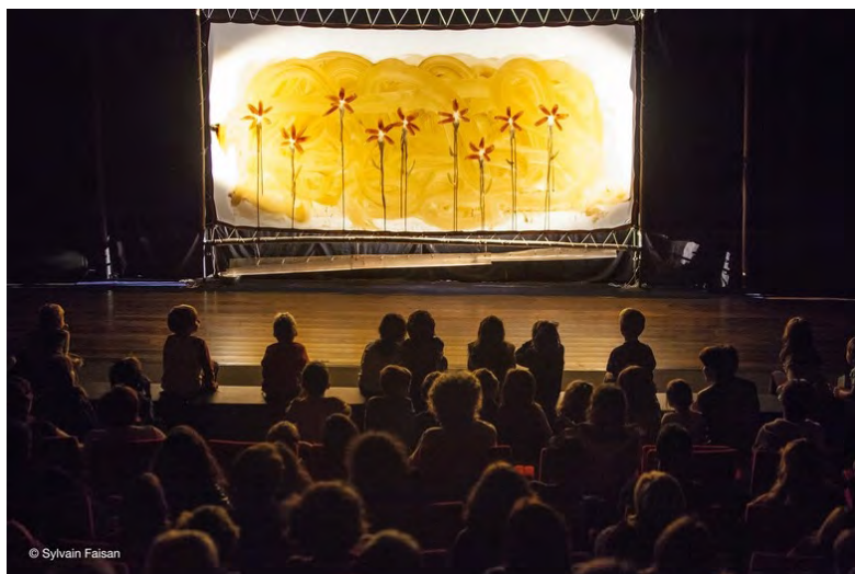
Fig.4: Spectacle Tierra Efímera au Diapason à St. Marcellin.