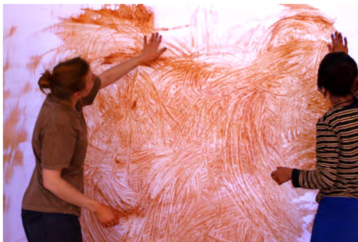
Fig.9 : Implication du corps pendant les ateliers de peinture en terre.