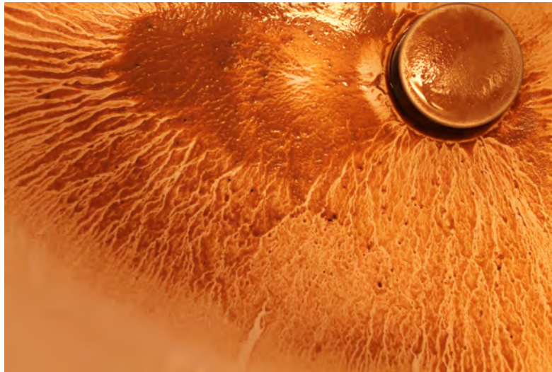
Fig.1 : Marques de ruissellement dans un évier.