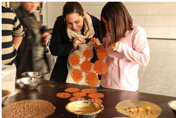
Fig.8 : L'effet de digitation est du à la différence de viscosité de deux liquides.