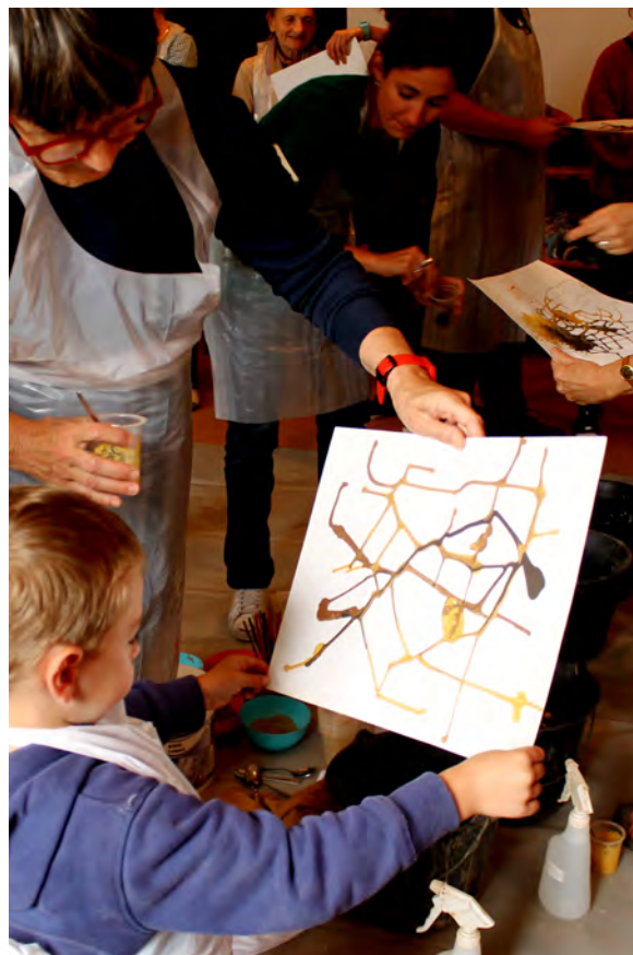
Fig.6 : Exploration du jeu des coulures avec la terre en état liquide.