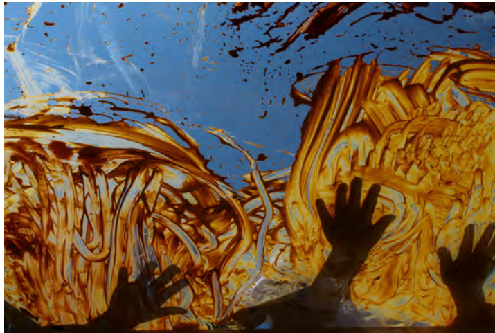
Fig.7 : Table transparente pour permettre la manipulation de la terre en hauteur et regarder les effets par dessous.