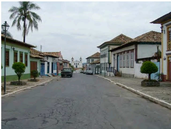
Figure 1. Vue partielle du centre historique de la ville de Santa Luzia. Photo o3L (octobre/2009).

de terrains irréguliers, avec des rues sinueuses, des bâtiments construits dans l'alignement et des grands jardins boisés. L'axe principal est la Rue Direita où se trouvent la chapelle du Nosso Senhor do Bonfim et l'église Matriz de Santa Luzia. En dépit d'être un champ d'exploration aurifère, la ville primitive s'est développée sur la base du commerce local, une fois que le site est situé au milieu du chemin des anciens bouviers, qui ont imprimé à l'endroit un caractère d'emporium commerciale entre les zones de Serro et Paracatu.