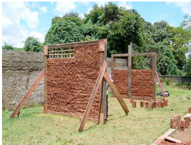
Figure 4. Vue partielle du chantier avec les murs en torchis et en adobes dont les techniques font partie de l'architecture traditionnelle locale. (octobre/2009).

des bâtiments du site historique. On a également constaté que la plupart des propriétaires des immeubles du centre historique associe la maçonnerie en terre crue aux murs de mauvaise qualité pour ne pas permettre l'adhésion d'enduits à base de ciment. On a souligné donc l'importance du choix des matériaux techniquement compatibles aux murs de terre crue. Initialement, il y avait une résistance considérable de la part des participants à utiliser de la chaux en remplaçant le ciment dans le mortier d'enduit. Mais au moment de la préparation et de l'application du mortier sable - chaux, il y a eu un consensus de la reconnaissance de la bonne maniabilité et de la facilité d'application du mortier, qui a été appliquée sur un côté du mur torchis, résultant en un revêtement uniforme, de faible retrait et de couleur claire. L'atelier de la journée suivante a été consacré entièrement à la peinture. Comme les surfaces enduites étaient suffisamment sèches, il a été possible d'appliquer les couches de peinture à base de chaux, des pigments et de l'eau avec des différents types de terre, réalisées par les participants. Les couleurs variées et la facilité de la fabrication et de l'application ont réveillé l'acceptation dans le groupe. La plupart était surpris par le résultat de la prise de l'enduit à la surface du mur et des possibilités décoratives de peintures à la chaux pigmenté avec de la terre.