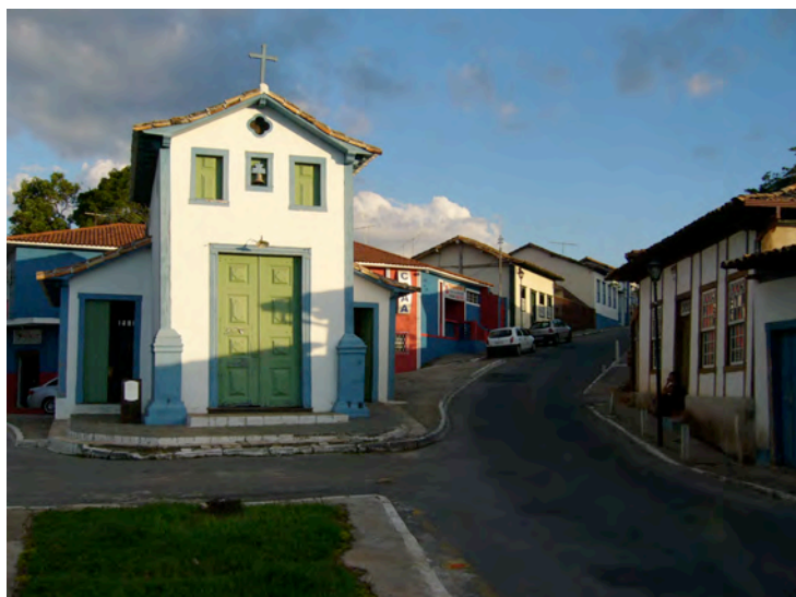
Figure 2. L'accès au centre historique depuis la chapelle Nosso Senhor do Bonfim. Photo o3L (octobre/2009).