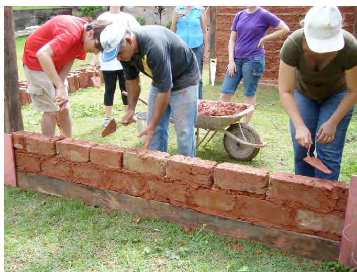
Figure 3. La mise en oeuvre des murs en adobes pendant la formation. Photo o3L (octobre/ 2009).

Ensuite il y a eu l'application de l'enduit et de la peinture sur le mur en torchis construit dans le module précédent. L'approche théorique du deuxième module a evidencé, avec beaucoup d'accent, l'utilisation de matériaux techniquement compatibles aux murs de terre crue, en donnant plus d'importance aux revêtements à base de chaux. L'hydratation de la chaux vive (CaO) a été réalisée un mois à l'avance de la mise en œuvre des enduits et de la peinture. La première inspection technique de reconnaissance du site historique à Santa Luzia a révélé que la plupart des pathologies des bâtiments en terre crue sont associées aux revêtements. De grandes surfaces d'enduits en ciment détachés, l'application de peinture synthétique, des taches sombres et de l'accumulation de la microflore sont des manifestations qui témoignent d'un entretien inadéquate ou inexistant