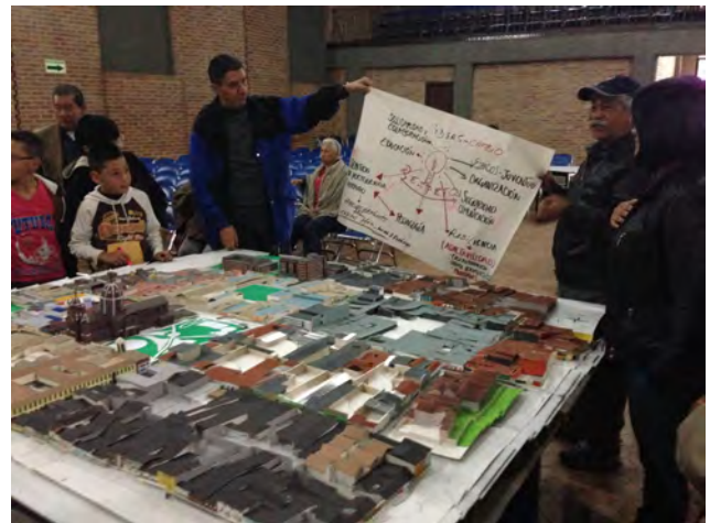
Figuras 3 y 4. Talleres sobre el material tierra y patrimonio, realizados con la comunidad