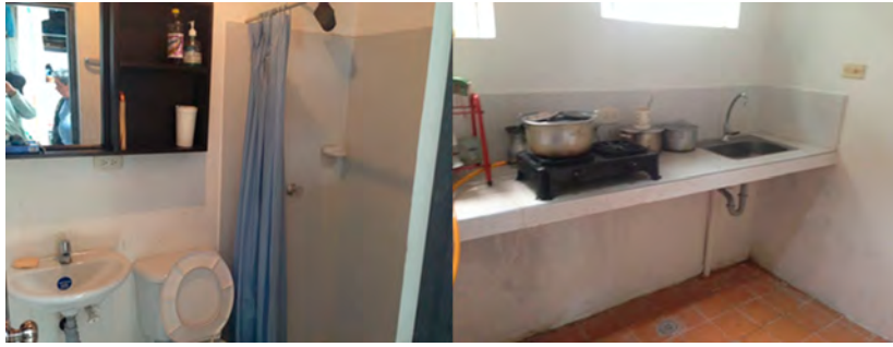
Figuras 7 y 8. Imágenes de algunos baños y cocinas, antes y después de la intervención

De otra parte, aunque los muros de tierra no generaban en ningún caso un problema en sí mismo para la habitabilidad del inmueble, aquellos que se encontraron afectados por recubrimientos con cemento u otros materiales habían desencadenado principalmente problemas de humedad, fueron intervenidos recuperando los pañetes con cal y arena, realizando de forma paralela actividades de capacitación y sensibilización con los propietarios y la comunidad (Fig. 9 y 10).