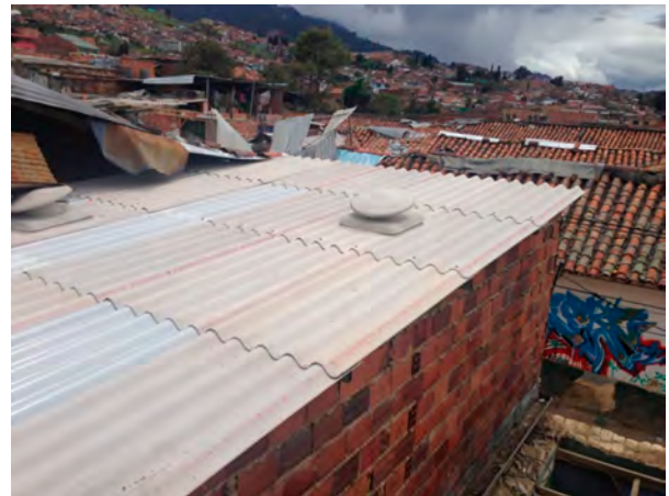
Figuras 5 y 6. Imágenes de algunas cubiertas, antes y después de la intervención