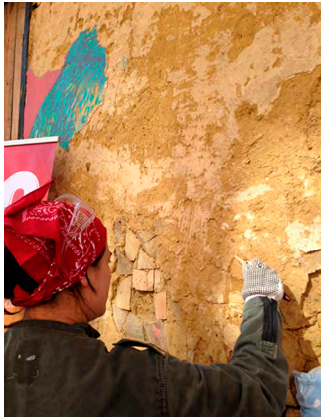
Figuras 9 y 10. Imágenes de intervención de muros de tierra

En junio de 2015, la CVP realizó un estudio de satisfacción con 123 beneficiarios del proyecto, en el que se identificó que 107 familias estuvieron satisfechas con las obras y adicionalmente 54 de las 123, continuaron realizando obras de mejoramiento a sus viviendas con recursos propios. Para esa fecha, el proyecto había beneficiado 500 personas, 238 hombres y 262 mujeres, de los cuales 202 eran adultos (27-59 años) y 117 mayores de 60 años.