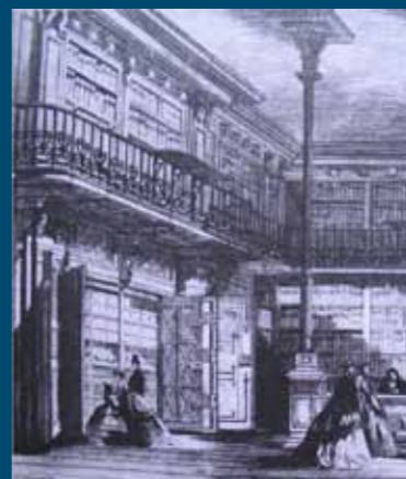
Un rituel ancien, l'ouverture de l'Armoire de fer des Archives nationales à l'Exposition universelle (gravure de Fichot, paru dans L'Illustration , 1867).