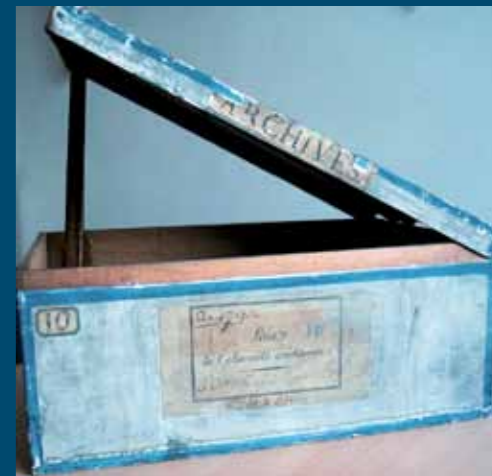
Boîte en chêne de la série A (Lois) des Archives nationales, fabriquée en 1790.