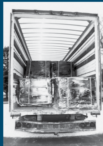
Palettes du premier camion transportant les fonds revenus de Moscou à Fontainebleau en 1994.