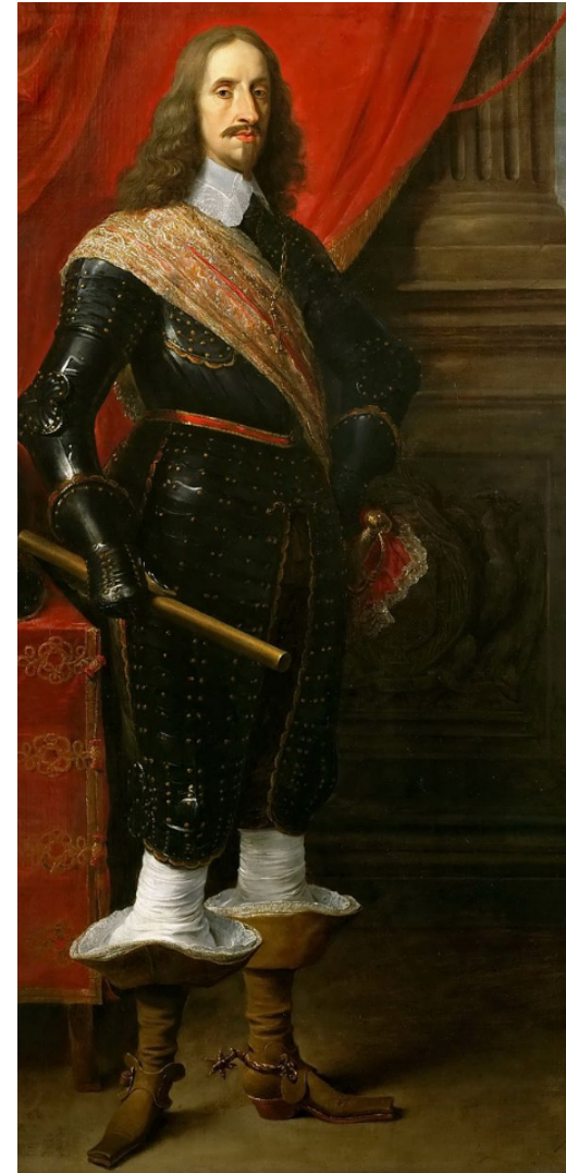
David Teniers d.J.: Eh. Leopold Wilhelm, Detail, um 1652, KHM Wien, 203x136