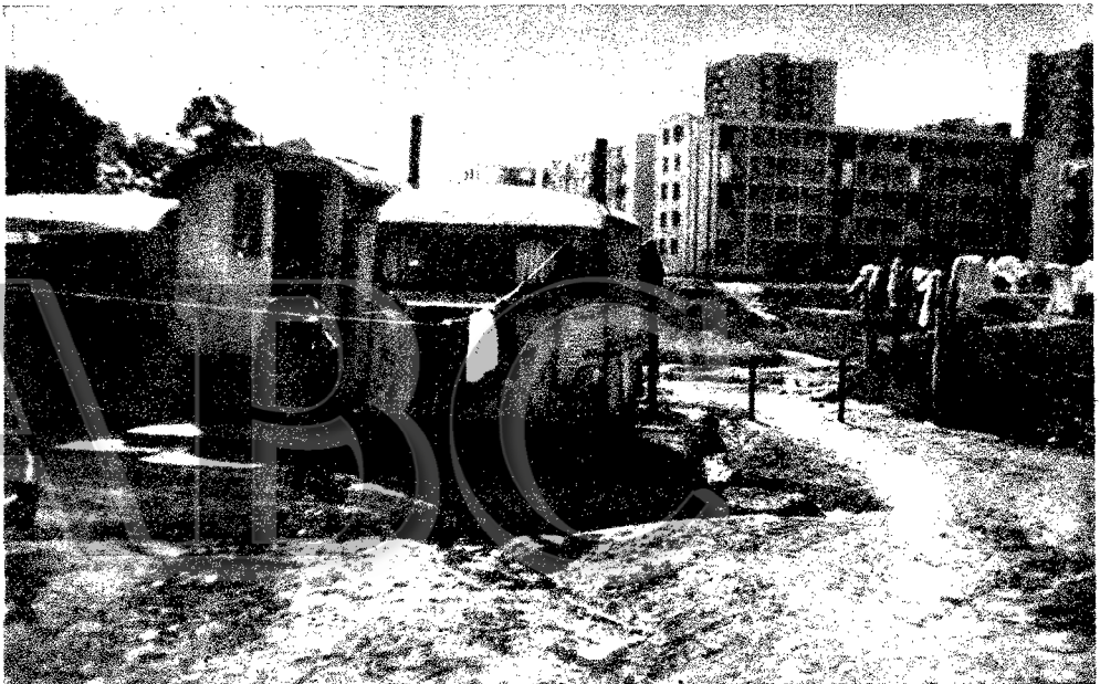
Vista parcial de "La Campa".