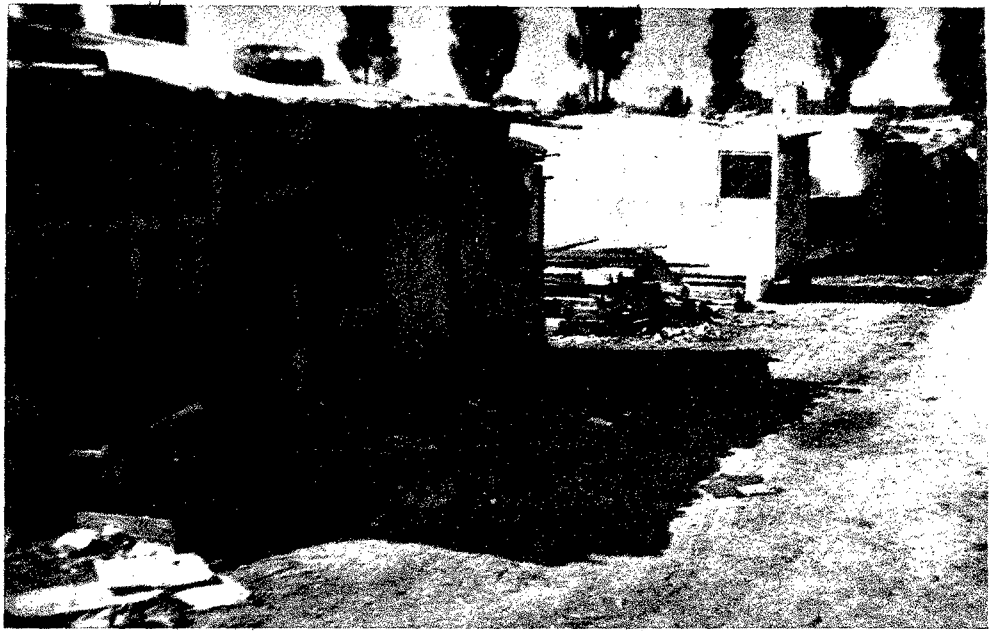
A la intemperie, cobijado por la sombra, duerme un hombre.