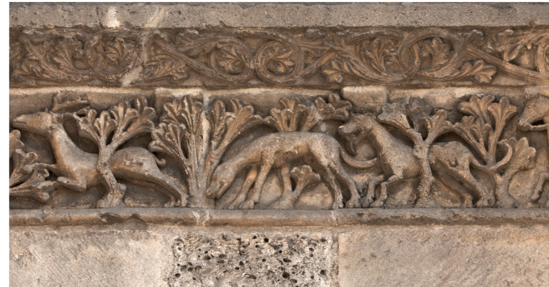
Représentation du cerf au Moyen-Âge.

Avant de l'utiliser, il faut néanmoins le récupérer. Comme dit précédemment, le bois animal est caduc, et son approvisionnement diverge de l'os dans ce sens. En effet, les populations peuvent le récolter soit par la chasse – il est appelé bois de massacre –, soit par le ramassage – il est alors appelé bois de mue. Pour les périodes médiévales, la faible proportion d'espèces sauvages par rapport aux espèces domestiques