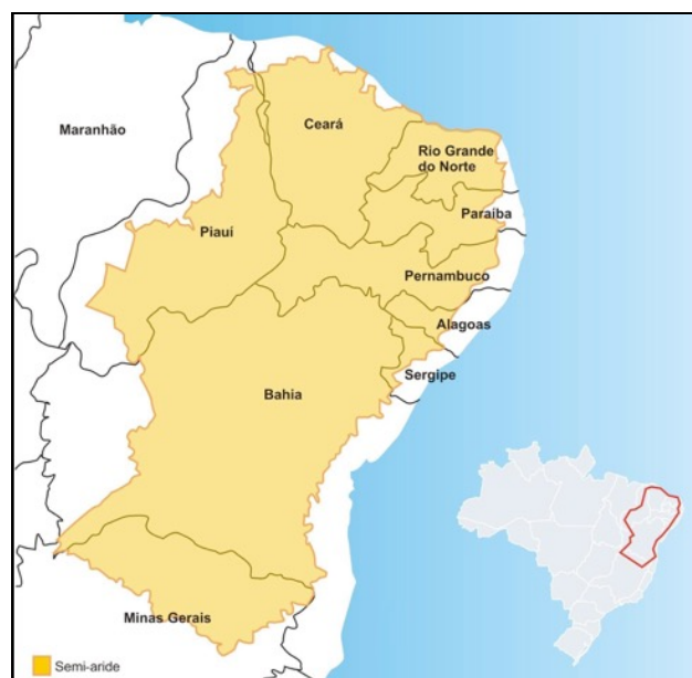
Figure 1. le Sertão ou Semi-aride brésilien

L'essence de la méthodologie choisie est l'ajout de variables et des idées pour le modèle en cours de construction à travers l'enquête de terrain. La stratégie utilisée pour cela est de se rapprocher des conditions dans lesquelles les individus attribuent des significations aux objets et aux événements, pour une description plus précise. L'approche adoptée vise l'ampleur, plutôt que de l'épaisseur (« breadth rather than thickness », Becker, 2001): nous cherchons à découvrir quelque chose sur chaque sujet que la recherche touche, même si tangentiellement. L'objectif est de comprendre le phénomène dans son ensemble, avec les interrelations de ses parties.