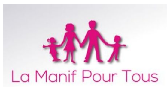
Figure 1. Logo du mouvement « La Manif pour tous »

Pendant la controverse elle-même, et en particulier dans les manifestations, la « Manif pour tous » s'est appuyée sur une représentation de la famille constituée d'un père, d'une mère et de deux enfants, un garçon et une fille, représentation qui s'est incarnée dans le logo du mouvement (cf. Fig.1). Ce modèle s'est vu renforcé dans les manifestations par l'usage du rose et du bleu, les couleurs marquant traditionnellement la différenciation des genres.