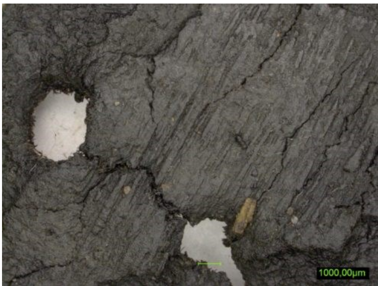
Abb. 1: Lederfunde vom Alten Markt.

Die Methode, konstruktionsbezogene Unterscheidungskriterien der Analyse zugrunde zu legen, hat sich für die Bearbeitung der sehr vielen, teilweise nur in kleinen Fragmenten erhaltenen Lederfunde bewährt. Auf diese Weise konnte insbesondere anhand der erkannten Verschlusskonstruktionen, sowie teilweise anhand der Sohlenformen eine Datierung der Grubenstratigraphie erfolgen und die Nutzungsdauer vom 10./11. Jh. bis ins frühe 13. Jh. ermittelt werden. Eine genaue Festlegung der einzelnen Schichten aufs Vierteljahrhundert, war nur bedingt möglich.