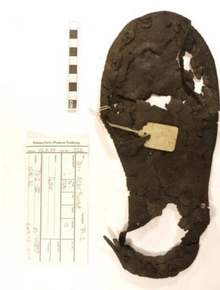
Abb. 3: mehrlagige Schuhsohle der Größe 47,5

auf. Für diese „Arbeitsschuh-These“ spricht nicht zuletzt das Fehlen von feinem und repräsentativem Schuhwerk im Fundgut. Regelmäßig waren stattdessen Schuhe mit verhältnismäßig einfachen, aber effektiven Verschlüssen, z.B. um den Knöchel oder Schlaufenösen.