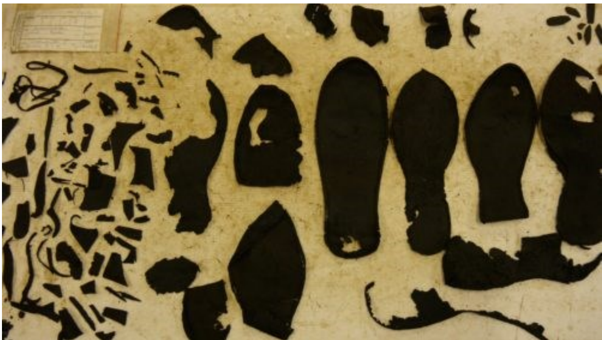
Abb. 2: Lederfunde vom Alten Markt, Fl. 2/8

Die Lederartbestimmung führte nur in seltenen Fällen zu eindeutigen Ergebnissen. Sowohl reguläre Abnutzung, als auch die Konservierung des Leders beschädigte die Narbenseite der betrachteten Lederfunde so sehr, dass kein eindeutiges Narbenbild mehr erkennbar war. In einem Fall konnte unter dem 3D-Mikroskop das Narbenbild einem Rind zugeordnet werden. Anhand des qualitativen Gesamteindrucks einer gewissen Derbheit des Leders und der Sohlenstärken bis zu 5 mm ist zu vermuten, dass es sich mehrheitlich um Rindsleder handelt.