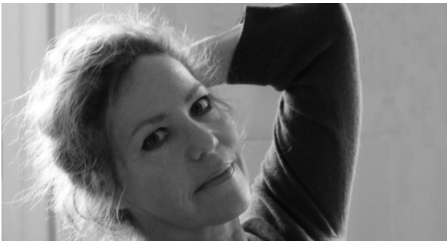
Sophie Loizeau

je passe sous silence moins que le souffle simple de la nuit me tient au secret pourtant rien que de très ordinaire la main heureuse d'un homme la veille à sa racine avant qu'elle ne devienne autre chose